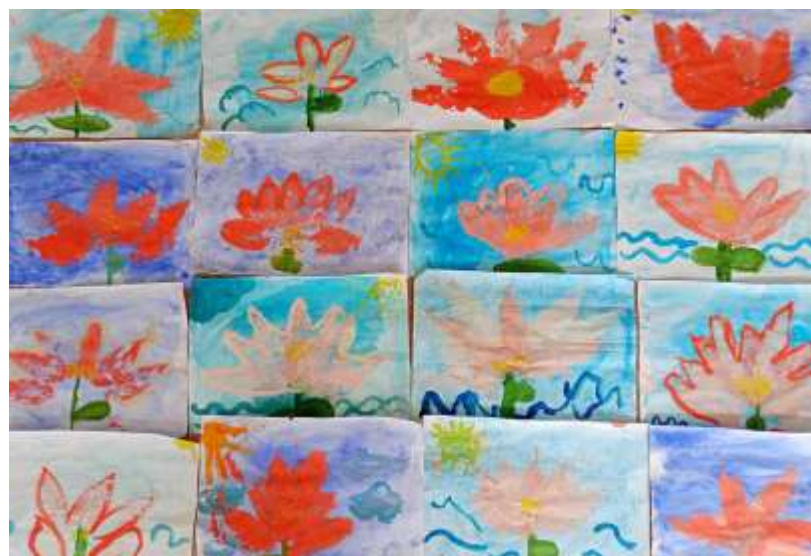
Рисование на тему: