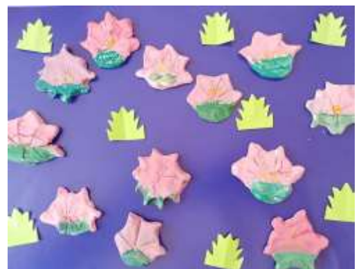
Лепка из соленого цвета и роспись «Фламинго и лотос» (плоскостная)