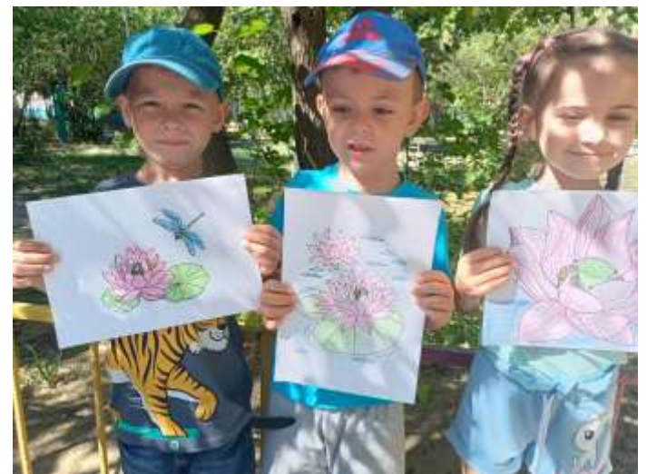
Работа с раскрасками.