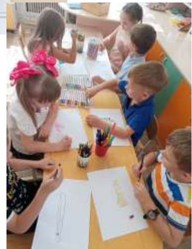
Иллюстрирование сказки Людмилы Орел «Сказка о лотосе».