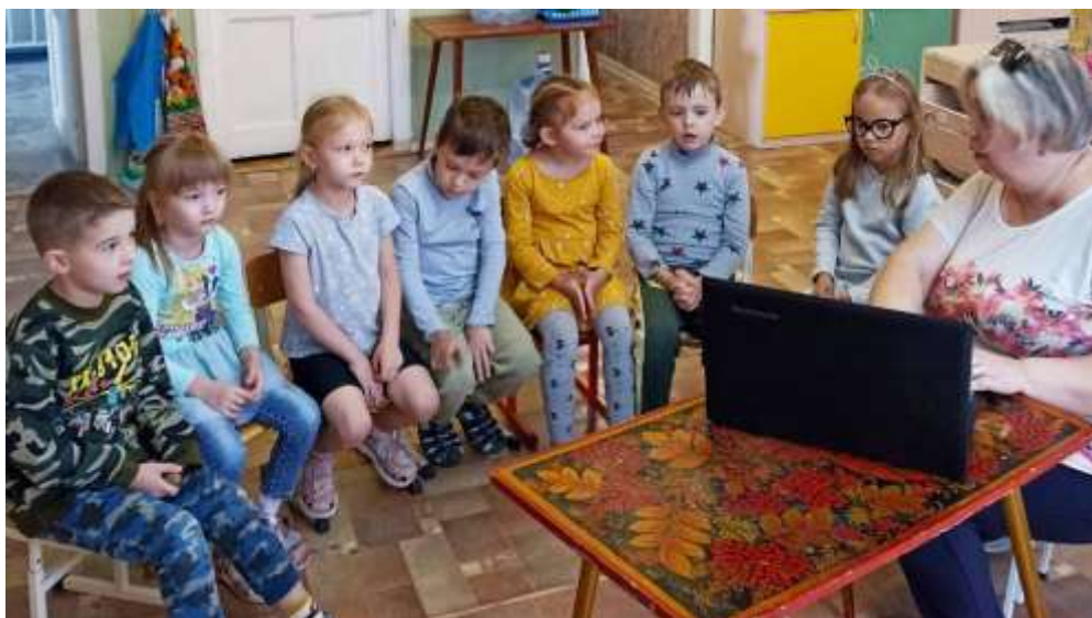
Рассказ воспитателя о Волго – Ахтубинской пойме.