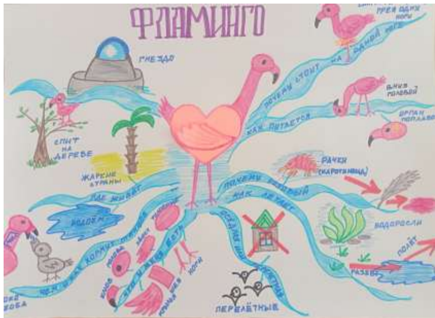
Работа над интеллектуальной картой «Фламинго»