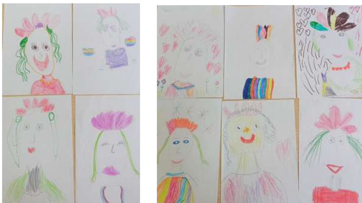
Рисование портрета прекрасной Эрле