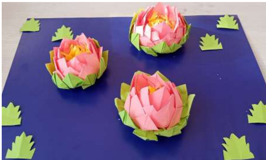
Конструирование из бумаги на тему: «Лотос – волшебный цветок» (коллективная: по подгруппам)