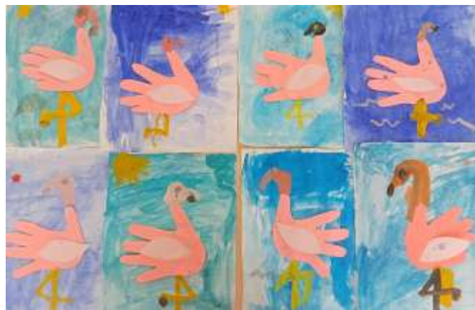
Рисование с элементами аппликации «Розовый фламинго»