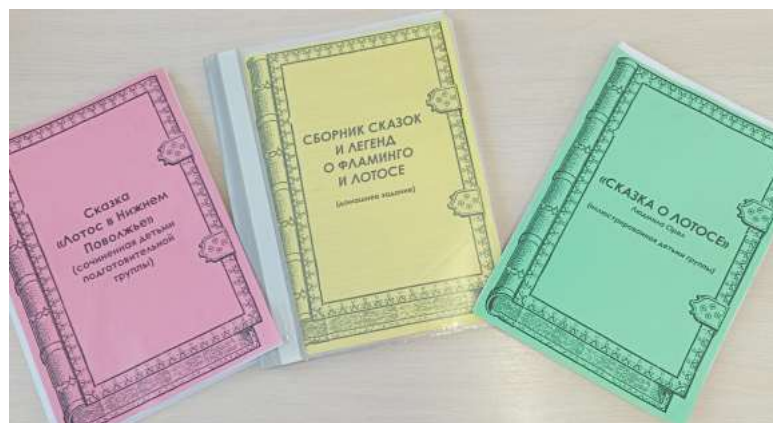
Иллюстрирование «сочиненной» детьми группы сказки «Лотос в Нижнем Поволжье»